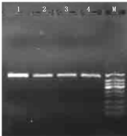
图 2 坛紫菜叶状体总 RNA 的逆转录检测结果

为进一步确定所提取的 RNA 能否满足后续相关分子生物学实验的要求,对离心柱试剂盒法和改良 CTAB 法提取的坛紫菜叶状体总 RNA 进行了逆转录检测,结果如图 2 所示。从图中可以看出两种提取方法获得的 RNA 均能成功进行逆转录反应,并扩增出一条与预期片段大小(约 500 bp)相符的清晰亮带。